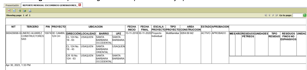
Imagen 3. Soportes cargados de disposición final y aprovechamiento. PIN 15974.