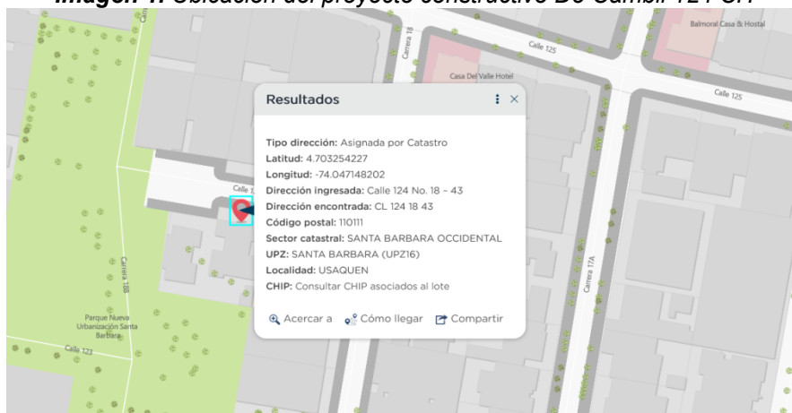
Imagen 1. Ubicación del proyecto constructivo De Cambil 124 CH

A partir del radicado No. 2018ER263076 del 09 de noviembre de 2018, la constructora Linero Álvarez Constructores S.A.S. realizó la inscripción del proyecto “De Cambil 124 CH” en el aplicativo web de la Secretaría Distrital de Ambiente, generando el número de identificación PIN 15974.